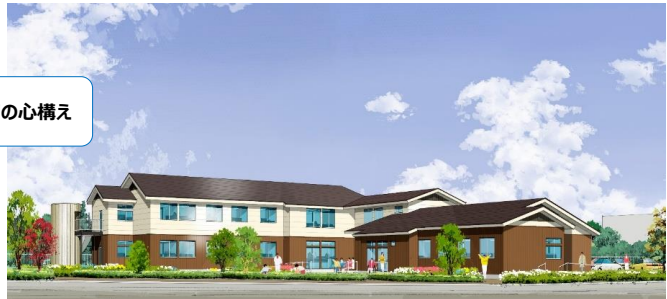
2018.4大山から神明町へ 新築移転しました